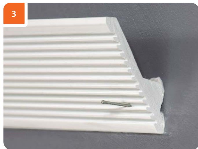
Аккуратно зафиксировать изделие финишными гвоздями, не повреждая рисунок орнамента (в данном случае финишный гвоздь размещен в пазу). На одно изделие нужно 3 финишных гвоздя.