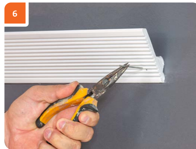
Удалить финишные гвозди спустя 24 часа.