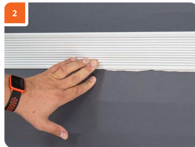
Прижать изделие по всей длине, чтобы клей выступил из-под всей плоскости примыкания.