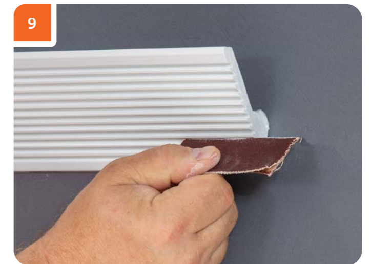
Спустя 3 часа мелкозернистой наждачной бумагой обработать зашпаклеванные места.