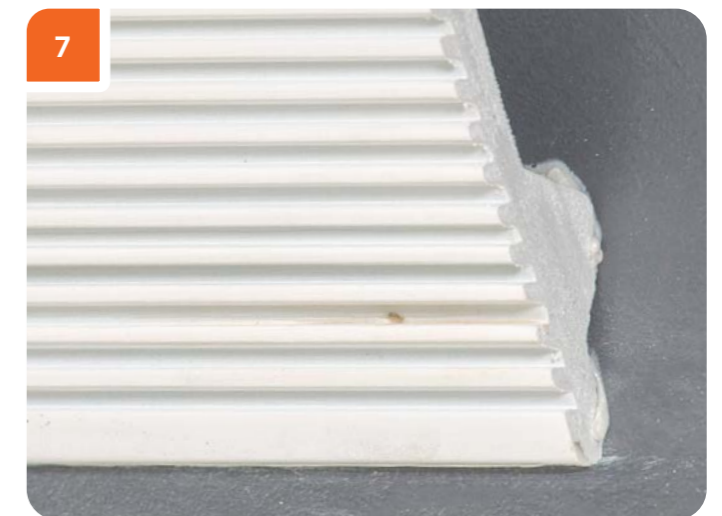
После удаления финишных гвоздей изделие не повреждается и рисунок орнамента сохраняется.