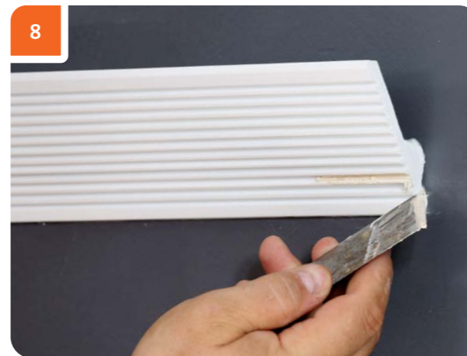
Зашпаклевать оставшееся после удаления финишного гвоздя отверстие с помощью мелкозернистой финишной шпатлевки на водной основе.