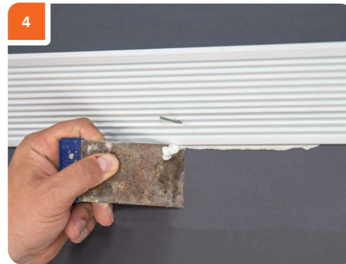
Удалить выступившие излишки клея шпателем.