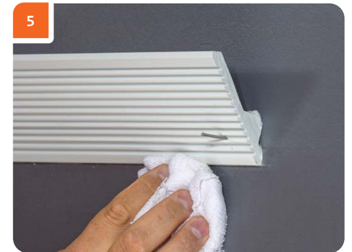
При необходимости места примыкания изделия к стене и потолку протереть тканью.