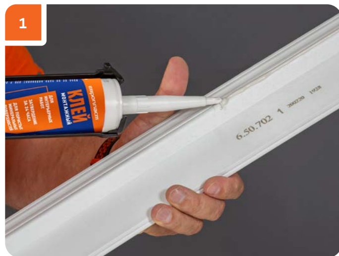
Равномерно нанести на монтажную поверхность клей по всей длине изделия.